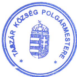
Varjas András polgármester

Határidő: 2020. december 20. a szerződés megkötésére