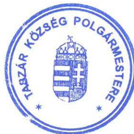
Varjas András polgármester

Határidő: 2020. december 30. a szerződés megkötésére